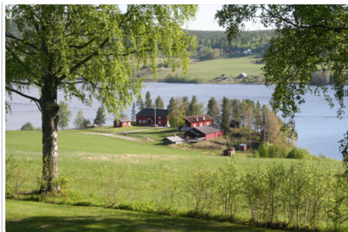
Hembygdsgården där fredagens konferens höll till.