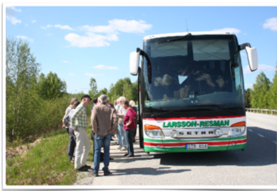
Fika på vädkanten gick också bra. Vi hörde Storspov och Bergfink och såg Enkelbeckasin.